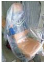
【付属品】 シートカバー 座席シートカバー ×2枚