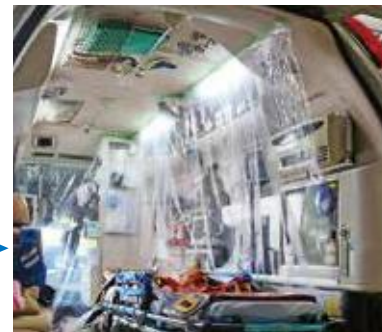
② 計器類の棚 (3枚) 幅1000×高さ2000mm×3枚