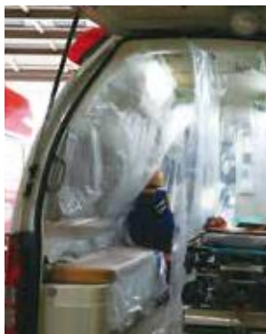
④ 左壁 幅1600×高さ2400mm×1枚 (静電気タイプ)