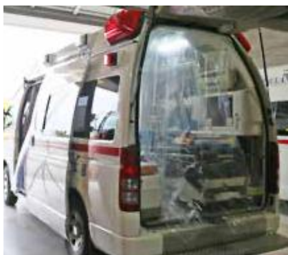
⑥ 後部 幅1700×高さ2000mm×1枚