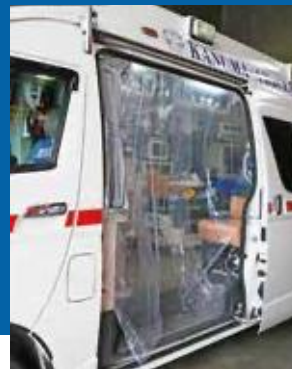
③ サイド入り口 幅1000×高さ2000mm×2枚