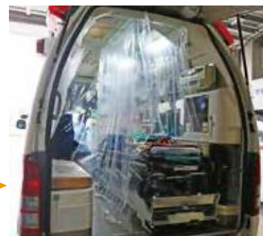
⑤ ストレッチャー 幅2300×高さ2000mm×1枚 ※②のパーツ3枚でも養生できます。