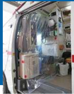
① 運転席側 幅1700×高さ2000mm×1枚