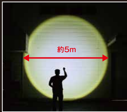
防水レスキューライト 1000