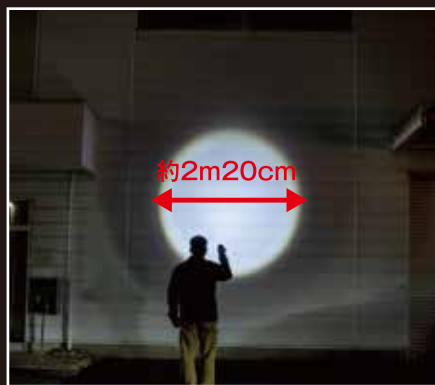
X3000 FS モデル