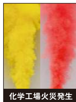
化学工場火災発生