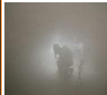
約1分後には何も見えなくなりました。