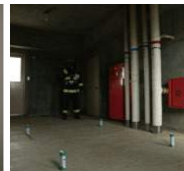
点火後約6秒で煙が発生。