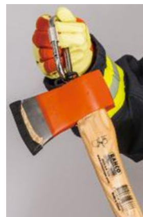
カラビナが掛けられるフック付