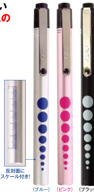
[ブルー] [ピンク] [ブラック]