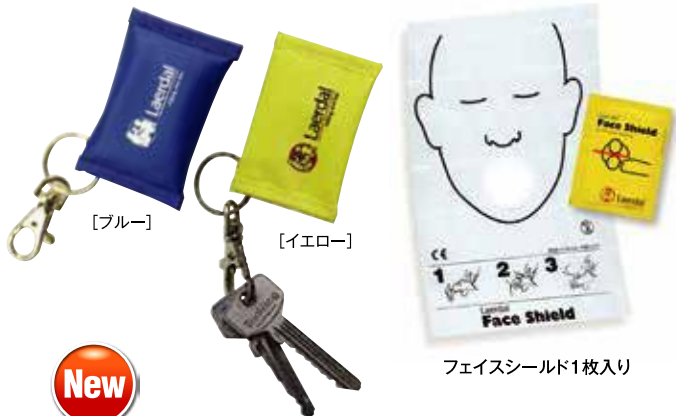
フェイスシールド1枚入り