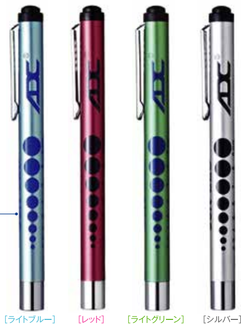
[ライトブルー] [レッド] [ライトグリーン] [シルバー]